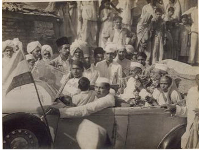
બાકરોલમાં મુસ્લિમ ભાઈઓ સ્વાગત કરે છે.