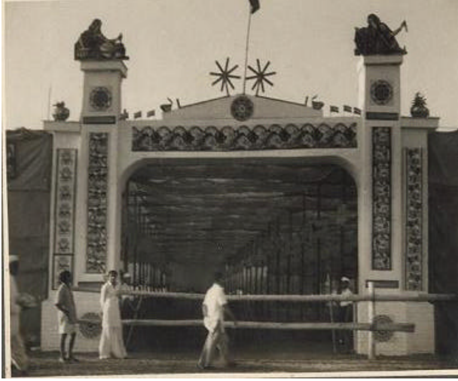
સેવાદળ શિબિરનું પ્રવેશદ્વાર : સ્વયંસેવકો શિસ્તબદ્ધ પહેરી ભરી રહ્યા છે.