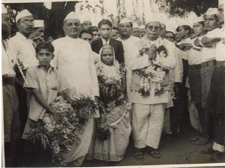
આણંદના રેલ્વે સ્ટેશને પ્રમુખશ્રીનું ભવ્ય સ્વાગત કરી સ્ટેશનનો ઘઘર ઉતરતા બાકરીલના નાગરિકો. તેમાં સ્વાગત પ્રમુખ તથા સ્વાગત મંત્રી દેખાય છે.